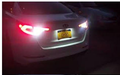
“Put it in reverse” Palanca de cambios en R