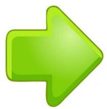
“Right signal” (Señal a la derecha)