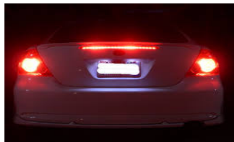
“Foot on the brakes” Frenos