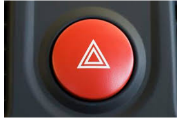
“Emergency lights” o “Four-way flashers” o “Hazard lights” (Luces de emergencia)