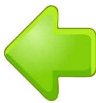
“Left signal” (Señal a la izquierda)