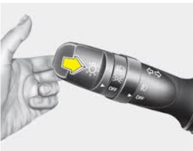
Tire la palanca hacia atras