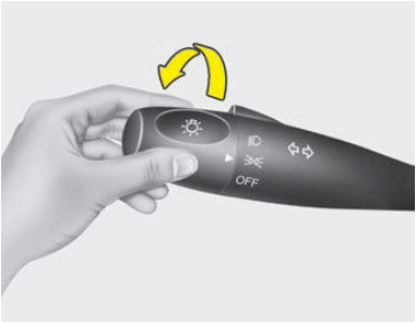
Gire hacia adelante dos veces